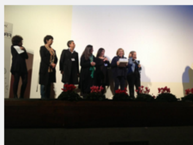
Il comitato promotore di Toponomastica Femminile alla premiazione di DonnaèWeb

Il progetto Toponomastica femminile , di cui vi abbiamo già segnalato il convegno nazionale e il numero dedicato della rivista Leggendaria , ha vinto il premio DONNAèWEB per la categoria Social!