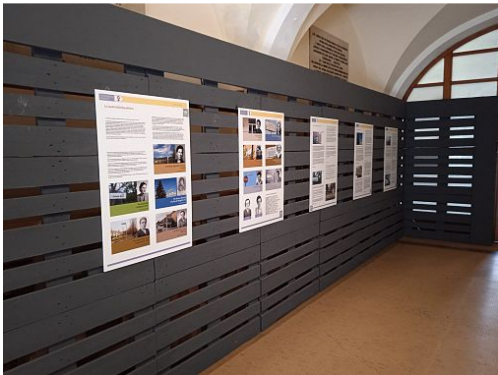
Alcuni pannelli della mostra