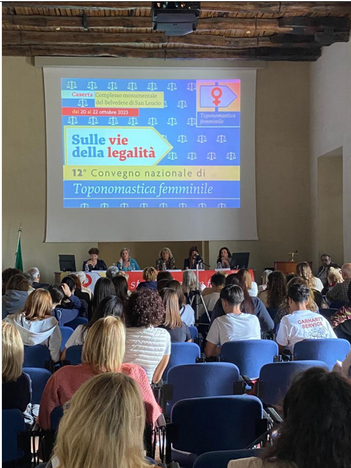
Un momento del convegno

Si è messo in risalto il diritto delle donne del godimento di spazi urbani che invece, oggi, sono discriminanti, le fragilità ambientali e le fragilità umane presenti soprattutto nei contesti urbani periferici.