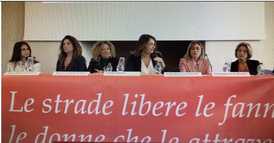
Un momento del convegno

"Sulle vie della Legalità": questo il tema del dodicesimo Convegno Nazionale di Toponomastica femminile svoltosi a Caserta.