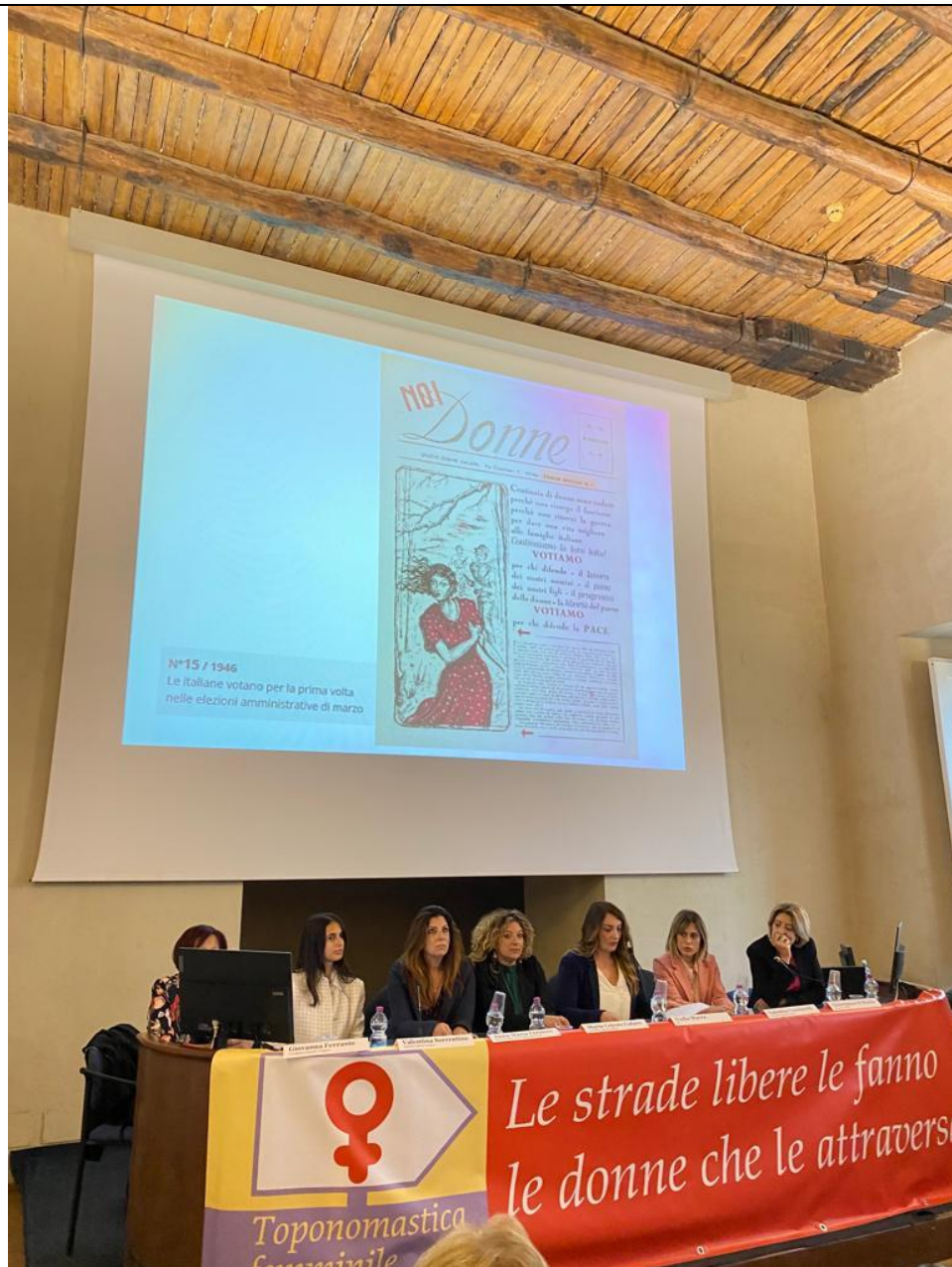
Un momento del convegno

Sono stati messi in risalto i pregiudizi e gli stereotipi di genere che ancora oggi permeano i Tribunali e sono state commentate le più significative sentenze della Corte di Cassazione riguardo la tematica della violenza contro le donne. Ed ancora gli stereotipi sessisti presenti nel linguaggio, spesso collegati ad apparati simbolici che abbiamo, inconsapevolmente, introiettato tramite la narrazione mitologica e storica.